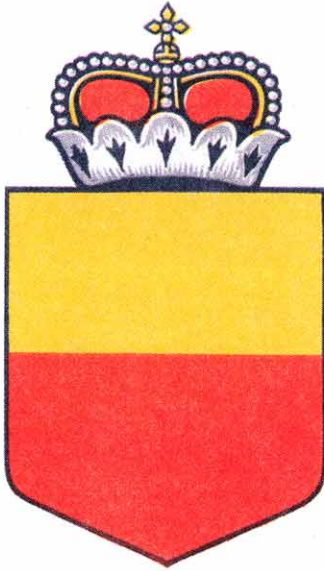
Emblema nacional de Liechtenstein